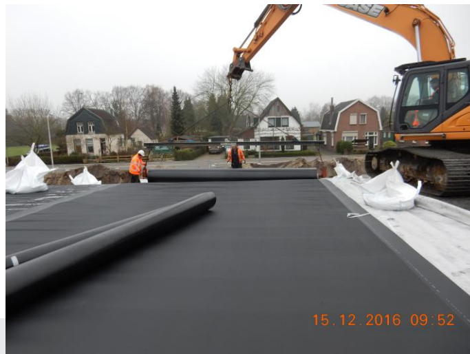
Foto: Aanbrengen HDPE-folie.